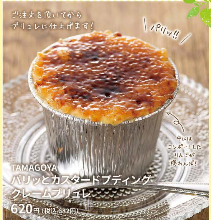
TAMAGOYA パリッとカスタードプディング クレームブリュレ