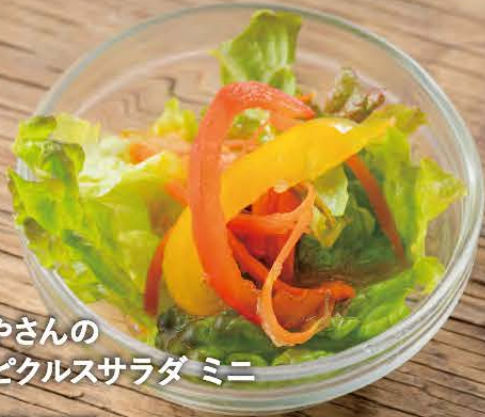
たまごやさんの 自家製ピクルスサラダ ミニ 250円(税込 275円)