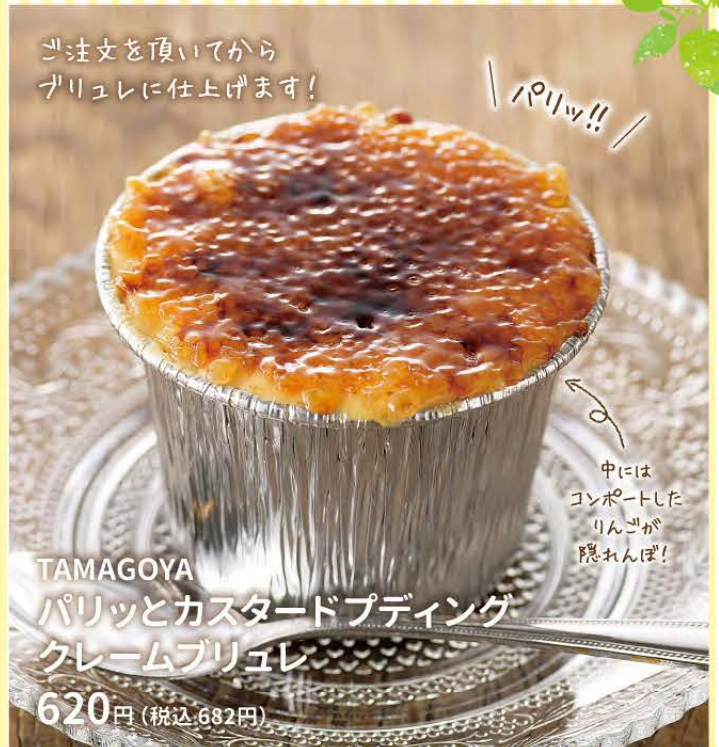
TAMAGOYA パリッとカスタードプディング クレームブリュレ