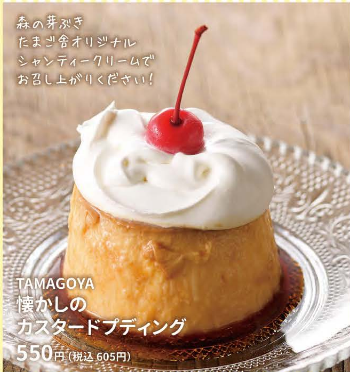
TAMAGOYA 懐かしの カスタードプディング