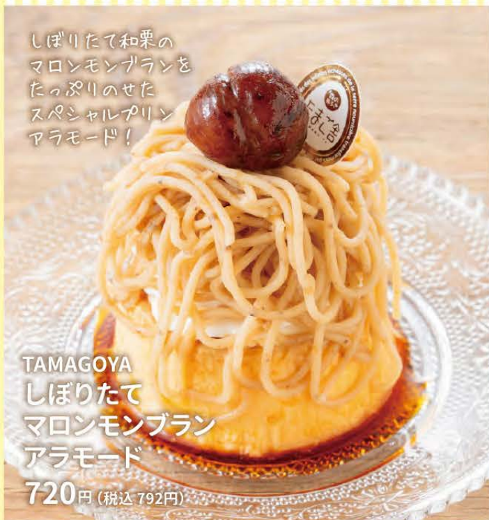
TAMAGOYA しぼりたて マロンモンブラン アラモード

しぼりたて和栗の マロンモンブランを たっぷりのせた スペシャルプリン アラモード!