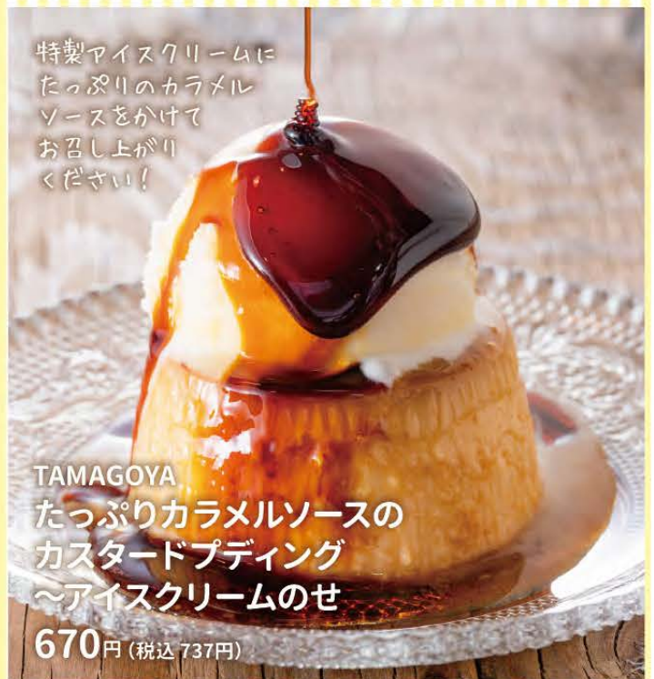
TAMAGOYA たっぷりカラメルソースの カスタードプディング 〜アイスクリームのせ

特製アイスクリームに たっぷりのカラメル ソースをかけて お召し上がり ください!